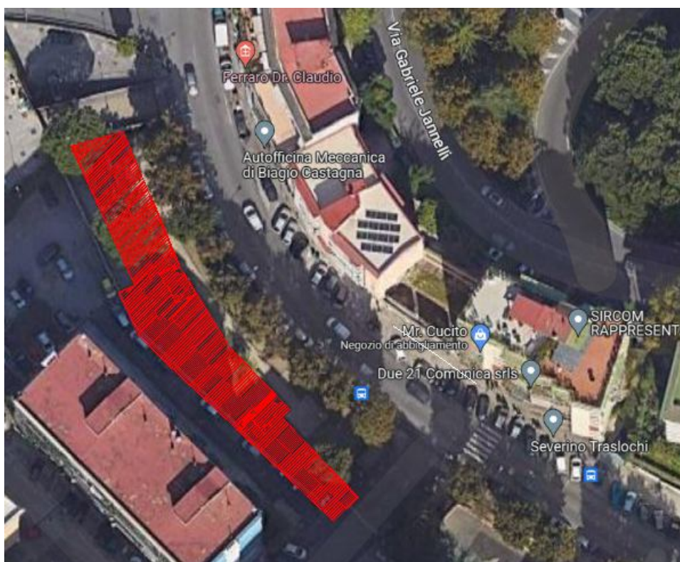
Figura 1 area di intervento

L'area totale selezionata (evidenziata in rosso nella figura 1) ha una ampiezza totale di 530,00 m 2 e un perimetro di 155,68m.